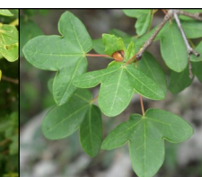
Feuille d'érable de Montpellier ↑