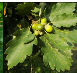
Chêne sessile, les glands n'ont pas de pédoncule marqué.