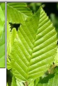
Feuille de charme →