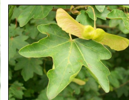
Feuille d'érable champêtre et son fruit (samare) ↑