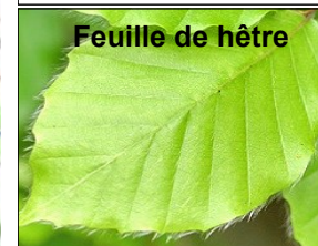
Feuille de hêtre

Cette phrase mnémotechnique permet de distinguer le charme (dont la feuille est dentée (« Adam = à dents ») du hêtre (« être ») dont la feuille est poilue (« à poil »). source: wiktionary