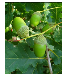
Chêne pédonculé, les glands sont portés par une longue tige (pédoncule) .